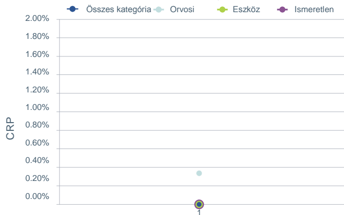
ELTÁVOLÍTÁSI ARÁNY ANALÍZIS KATEGÓRIÁK, GYERMEKEK