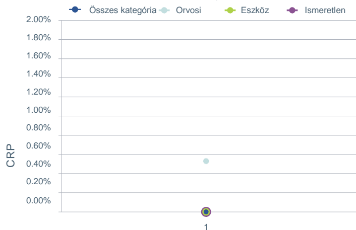
ELTÁVOLÍTÁSI ARÁNY ANALÍZIS KATEGÓRIÁK, FELNŐTTEK