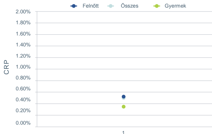
ELTÁVOLÍTÁSI ARÁNY ANALÍZIS AZ ÖSSZES KATEGÓRIÁRA, KÜLÖNBÖZŐ BETEGPOPULÁCIÓKRA